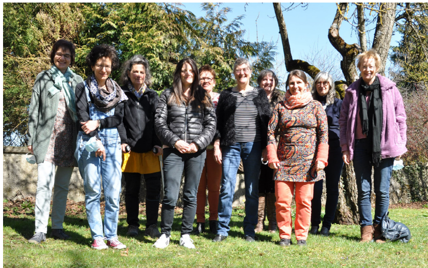
Journée de rencontre de l'équipe infirmière, en mars 2021 à Coffrane. L'équipe, en petit comité, a pu profiter d'une belle journée ensoleillée.

Une équipe formidable qui donne de son temps et de ses compétences auprès des enfants malades.