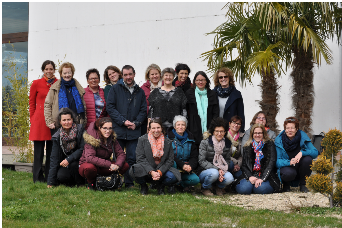
L'équipe en mars 2018. Certaines personnes ne figurent pas sur la photo

Toutes ces personnes donnent de leur temps, de leur énergie, de leur coeur et de leur âme aussi.