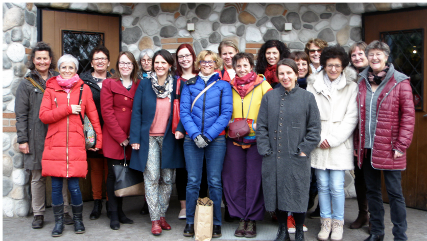
L'équipe en mars 2019. Certaines personnes ne figurent pas sur la photo

Une équipe formidable qui oeuvre et donne de son temps et de ses compétences auprès des enfants malades.