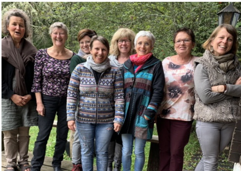
L'équipe, en comité très restreint, lors de nos journées de formation aux Paccots en septembre 2020.

Une équipe formidable qui oeuvre et donne de son temps et de ses compétences auprès des enfants malades.